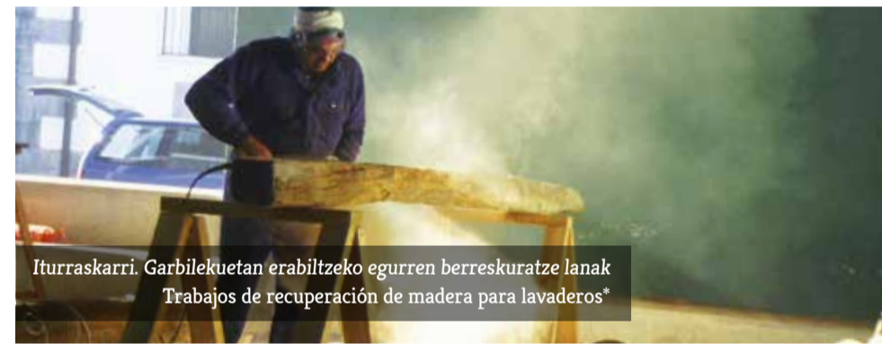
Iturraskarri. Garbiletuetan erabiltzeko egurren berreskuratze lanak Trabajos de recuperación de madera para lavaderos*

2006. urtean jarri zen martxan eta urte hauetan, garbitokiak, iturriak, askak, konjurutokiak, ferratokiak, korrikalekuak eta berdeguneak berritu ditugu. Horretaz gain, zonaldeko herri guztiak lotzen dituzten bide asko, natur bideak, Donejakue bidea, errege-bideak, errege-abelbideak, mandazainen bideak, suebakiak, gurdibideak eta xendak garbitu, markatu eta bertan mantentze-lanak egin ditugu. Horiek guztiak historia, bitxikeria, edertasun eta eza-gutza ugari gordetzen dute bere barnean. Guk horiei buruzko ezagutza bultzatu nahi dugu, merezi duten errespetuaz eta zain-tzaz zainzailatzeko eta aldi berean baloratu eta gozatzeko.