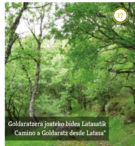
Goldaratzera joateko bidea Latasatik Camino a Goldaratz desde Latasa*

Horretarako, zonaldeko herriak lotzen dituen oinarrizko bide-sarea ireki dugu. Zenbait zatitan, bide zaharrak eta errepideak bat egiten dute; beste batzuetan, hartuta daudelako, itzulginguru txiki bat egin beharko da. Baina zati gehienetan bide-sare honek bide zaharrak jarraituko ditu eta zenbaitetan laborantza-bideak eta gurdibideak.