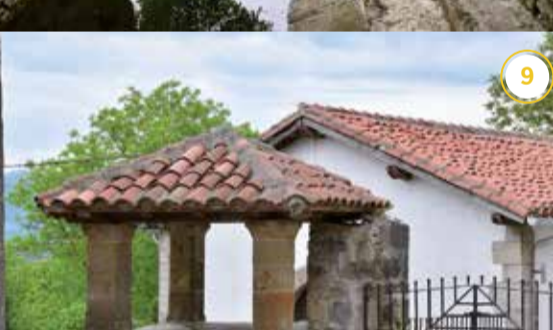
Etxarriko Konjurutokia Konjurutoki de Etxarri (Larraun)*