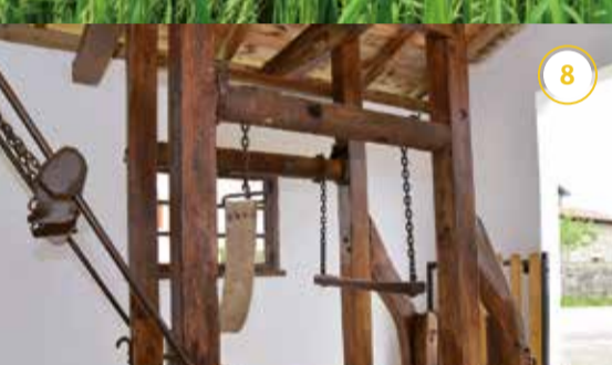
Mugiroko Perratokia - Perratoki de Mugiro*