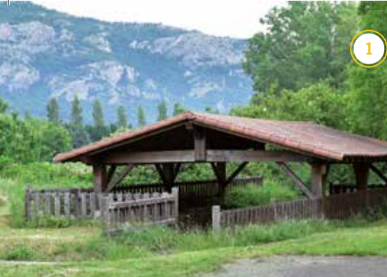
Arruazuko Garbilekua - Lavadero de Arruazu*

El consumo de agua se ha multiplicado en los últimos años. Consumimos cada vez más agua cuando evidentemente es un recurso limitado que no puede crecer. Tenemos que aprender a vivir con los recursos que tenemos y realizar un consumo responsable en vez de reclamar tanto como queremos. El futuro es incierto si seguimos en esta progresión, pero está en nuestras manos cambiarlo. Cerrar el grifo cuando nos lavamos los dientes, utilizar la lavadora y el lavavajillas cuando están llenos, ducharnos en lugar de llenar la bañera, practicar una jardinería de bajo consumo de agua..., son acciones sencillas que posibilitan un uso consciente del agua como elemento "limitado", pero por encima de esas pequeñas acciones solidarias, deberán estar las administraciones, industrias, ganaderías... comprometidas en la gestión responsable de un bien que es un derecho para todos.