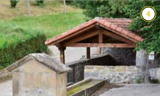
Egiarretako Garbilekua - Lavadero de Egiarreta*