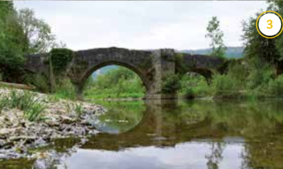
Donejakue bidea Arakil ibaiaren gainetik Irañetan Camino de Santiago sobre el río Arakil en Irañeta