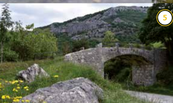
Plazaolako zubia Irurtzun Puente del Plazaola en Irurtzun*