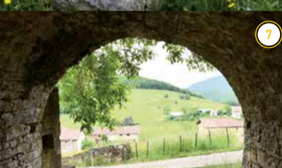
Oskotzko Garbilekua - Lavadero de Oskotz