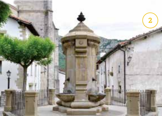
Uharte Arakilgo Iturria - Fuente de Uharte Arakil*