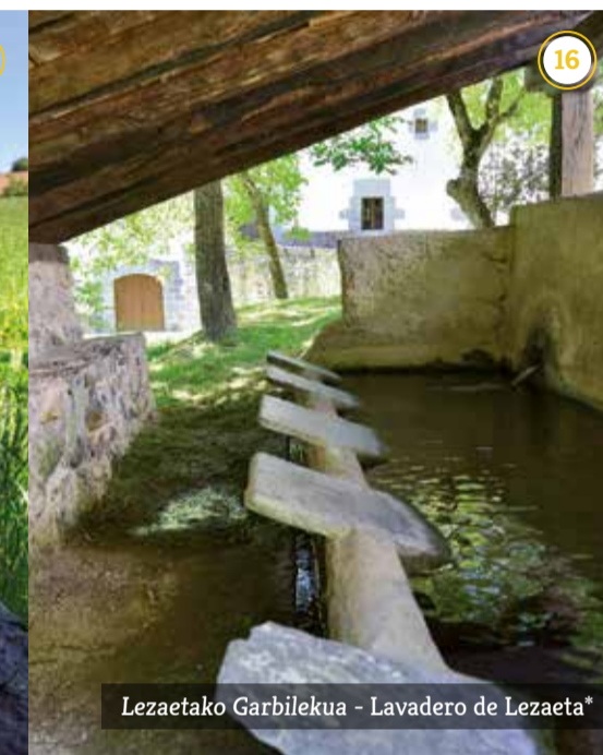
Lezaetako Garbilekua - Lavadero de Lezaeta*