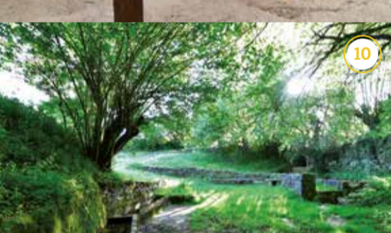
Astitzko Garbilekua - Lavadero de Astitz*