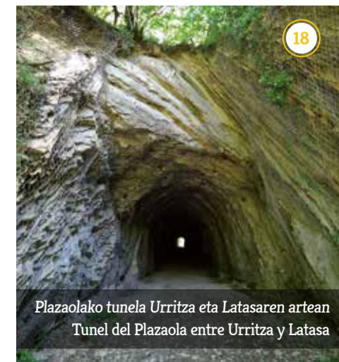
Plazaolako tunela Urritz eta Latasaren artean Tunel del Plazaola entre Urritz y Latasa

Para ello se ha abierto una red básica que comunica los pueblos de la zona. En algunos tramos el asfalto coincide con el camino viejo y en otros, por ocupación, habrá que dar un pequeño rodeo. Pero en la mayor parte siguen los caminos viejos, con tramos de caminos de carro (gurdibides) y pistas agrarias.