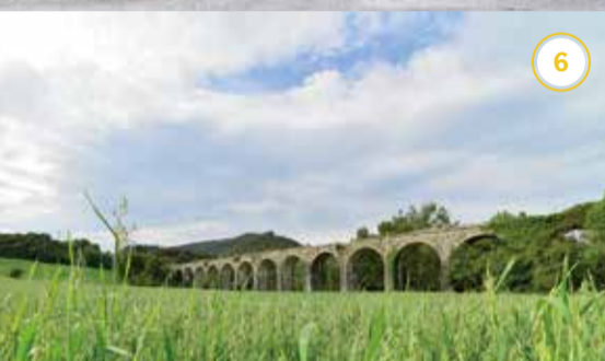
Plazaolako bidezubia Gulinan Viaducto del Plazaola en Gulina